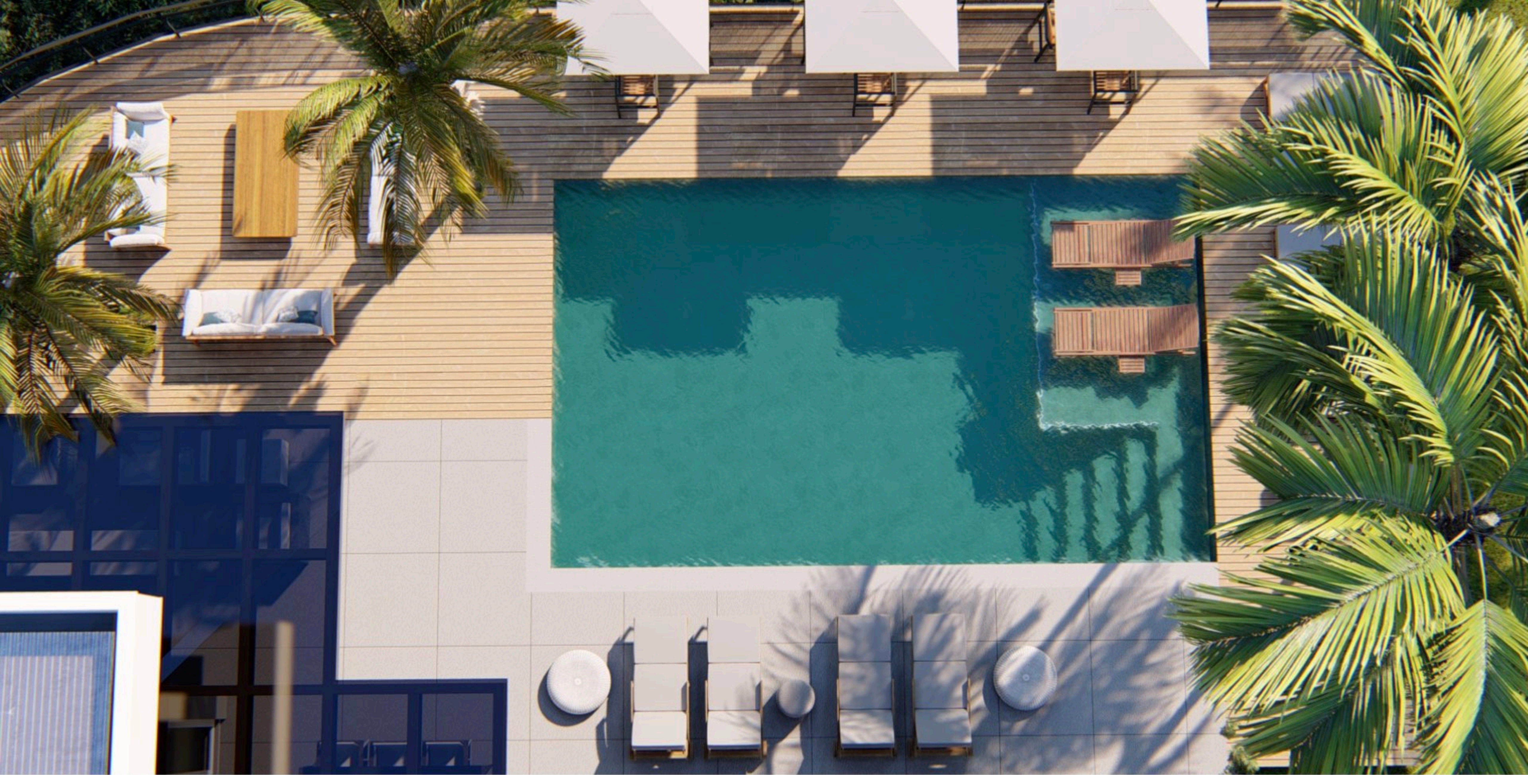
Residência GT . 800 m2 . Blumenau, Santa Catarina