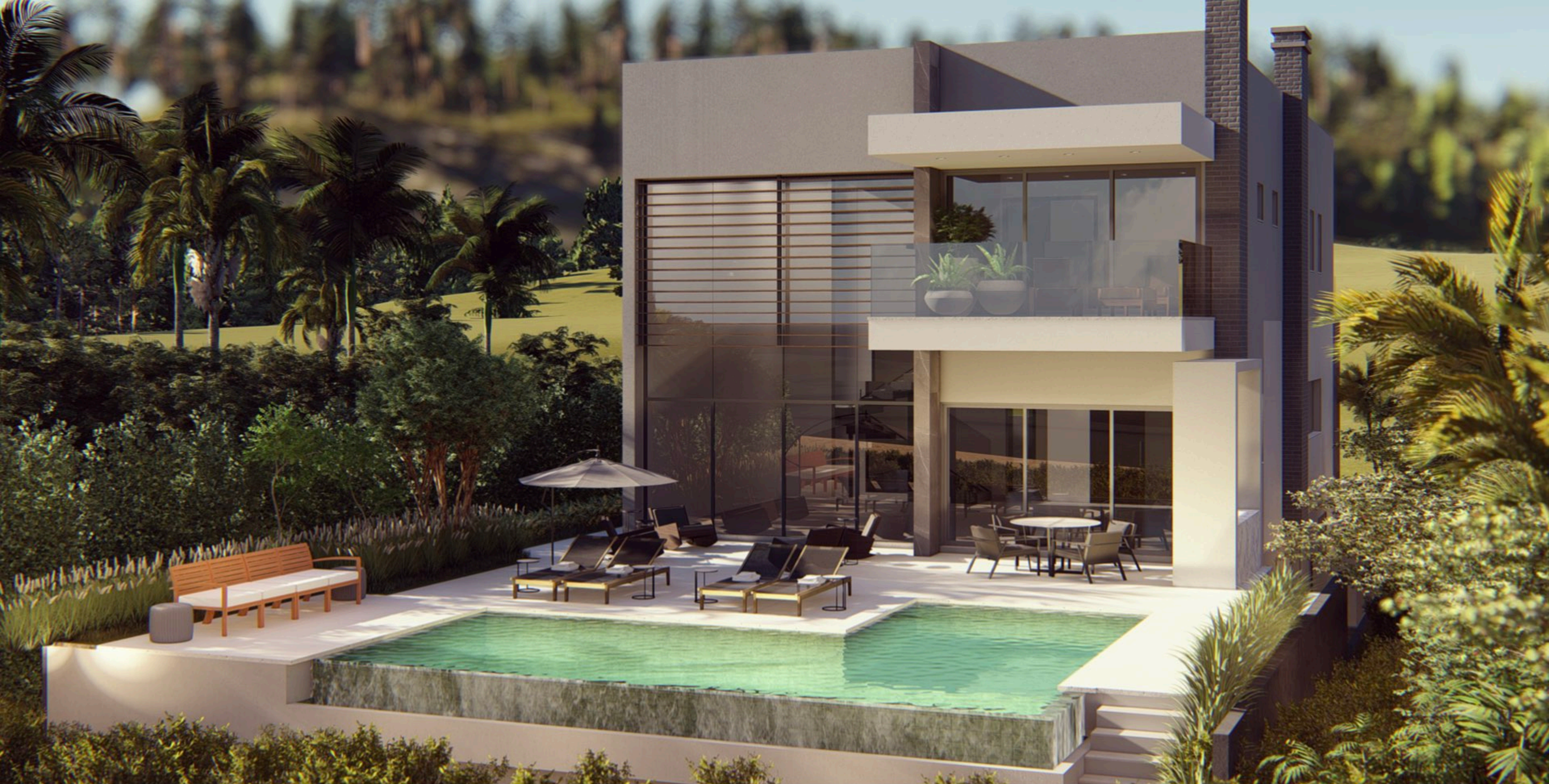
Residência SF . 750 m2 . Balneário Camboriú, Santa Catarina