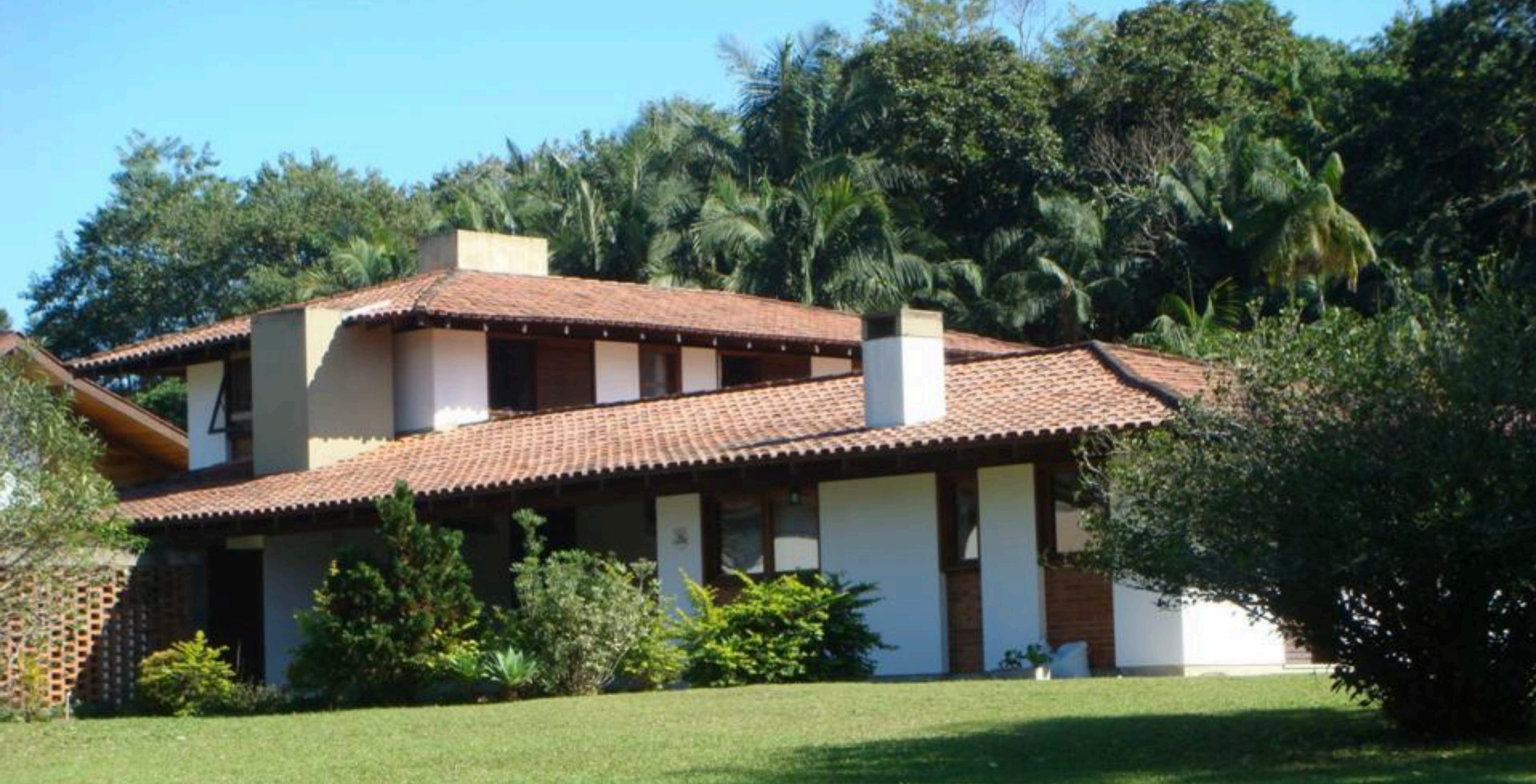
Residência RH . 360 m2 . Blumenau, Santa Catarina