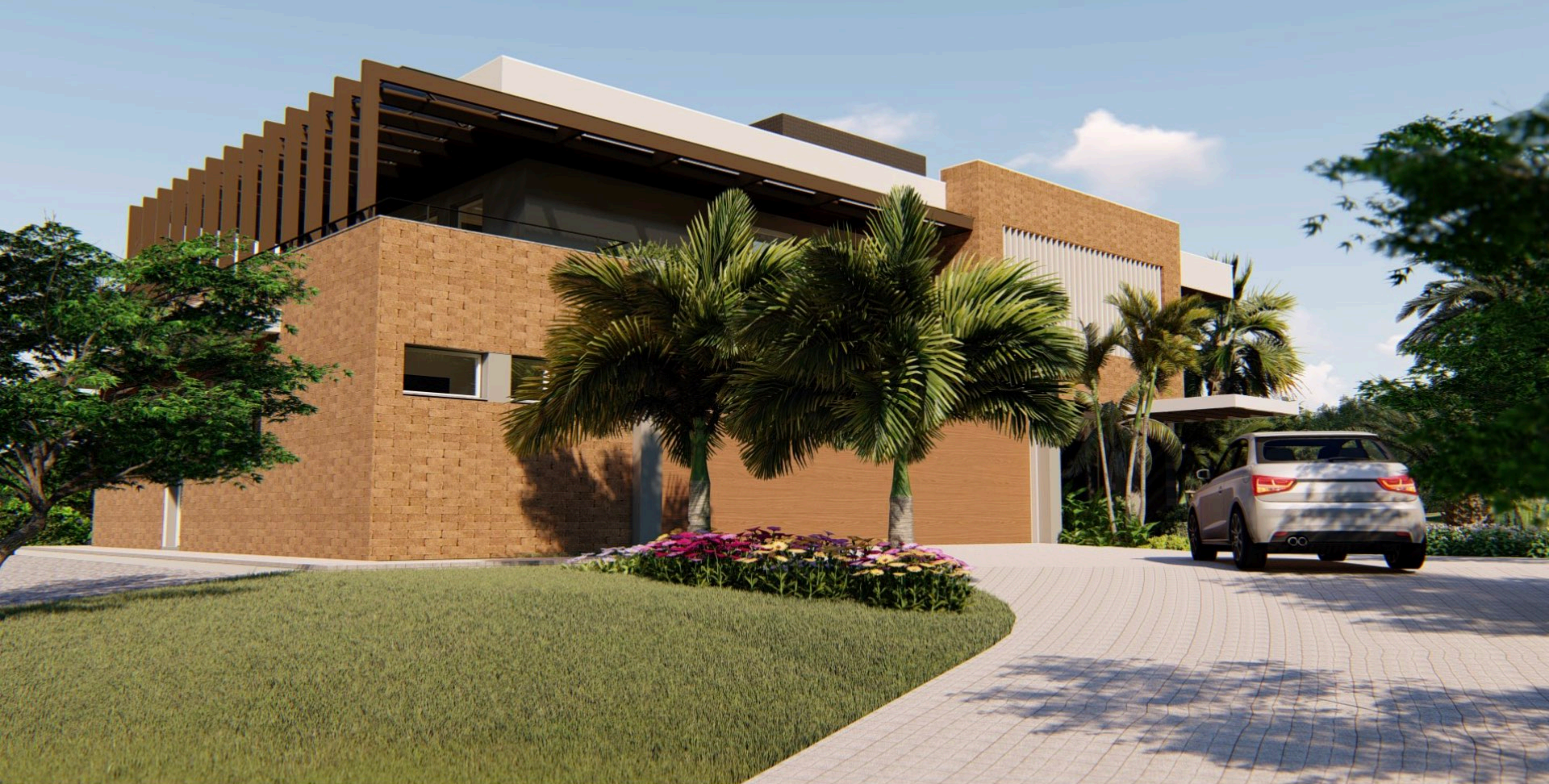
Residência GT . 800 m2 . Blumenau, Santa Catarina