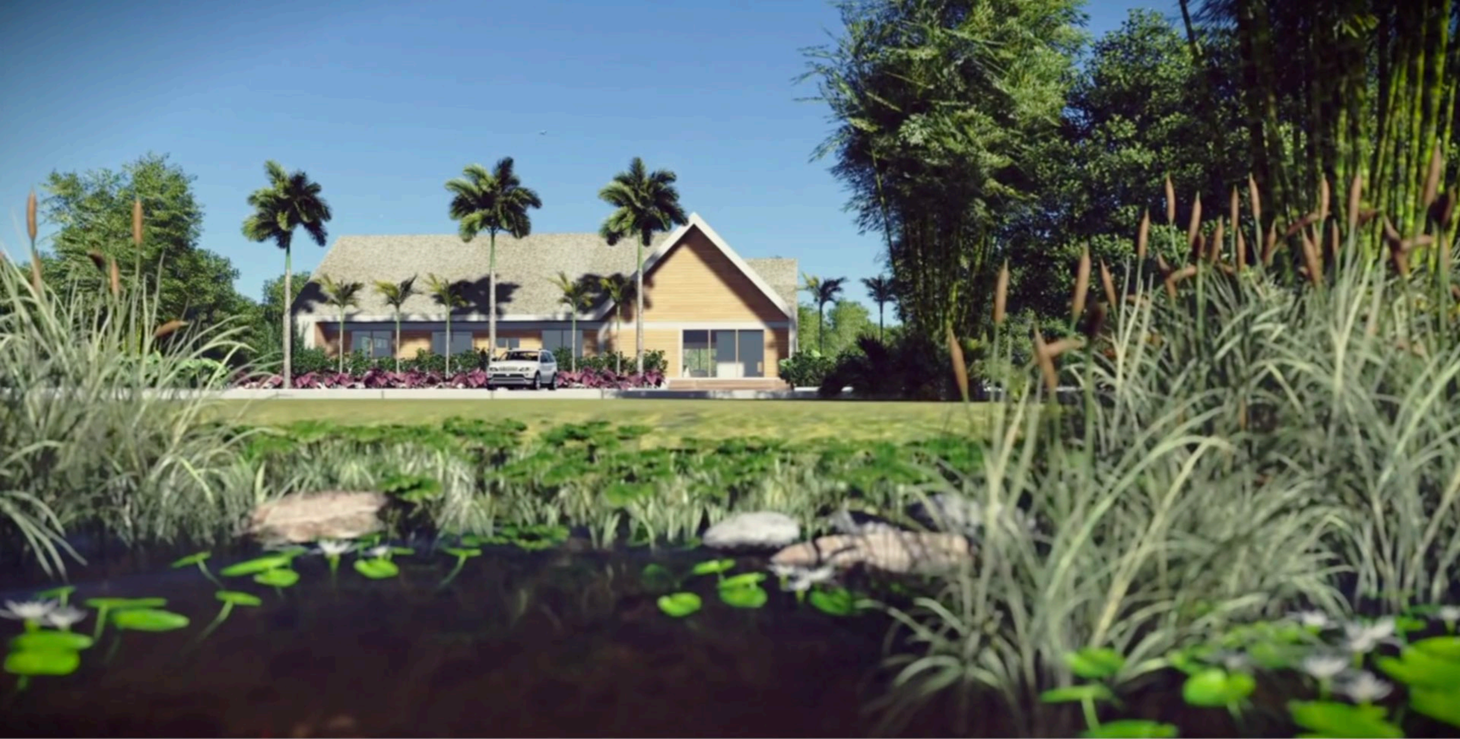
Residência HH . 700 m2 . Morretes, Paraná