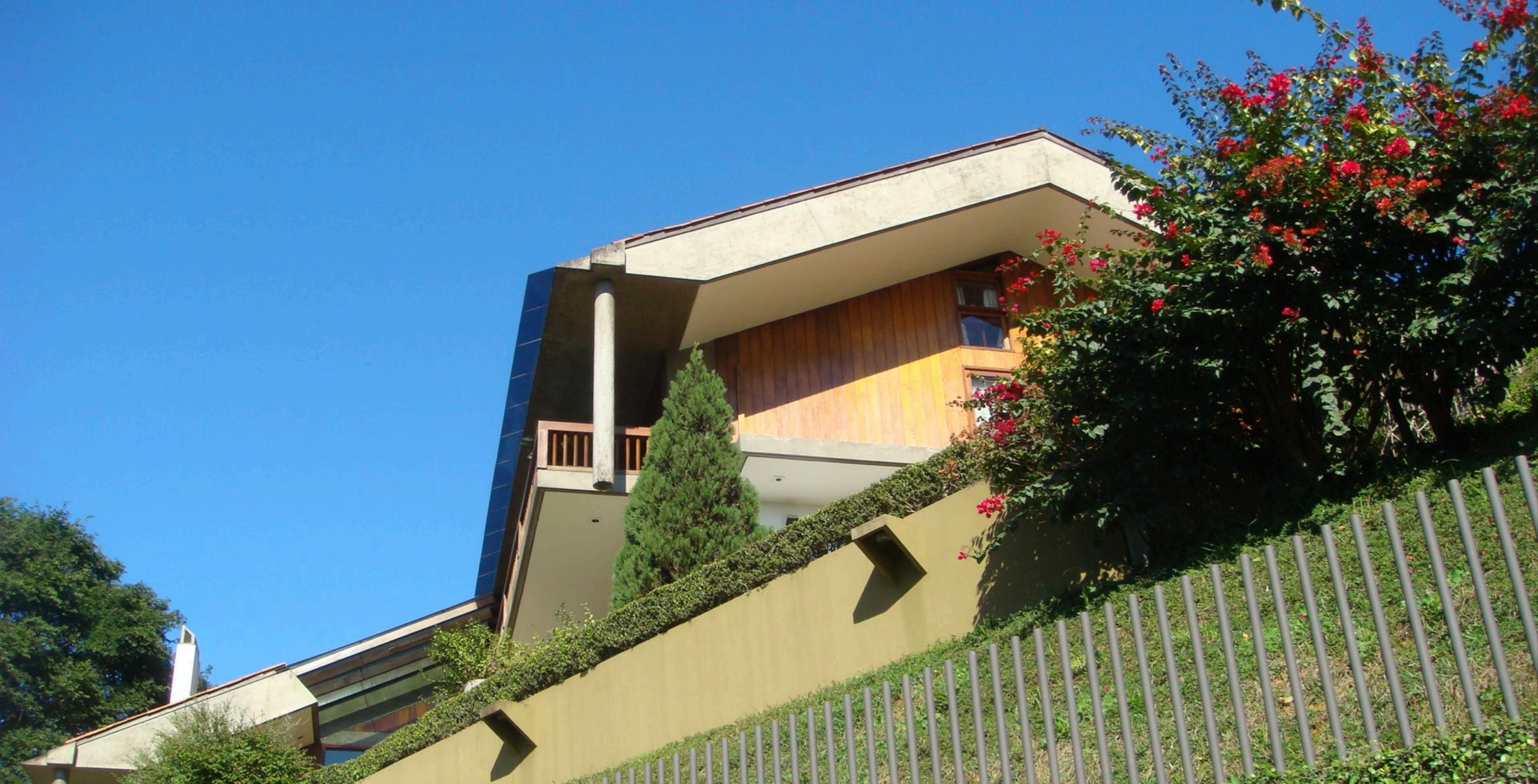
Residência RW . 600 m2 . Blumenau, Santa Catarina