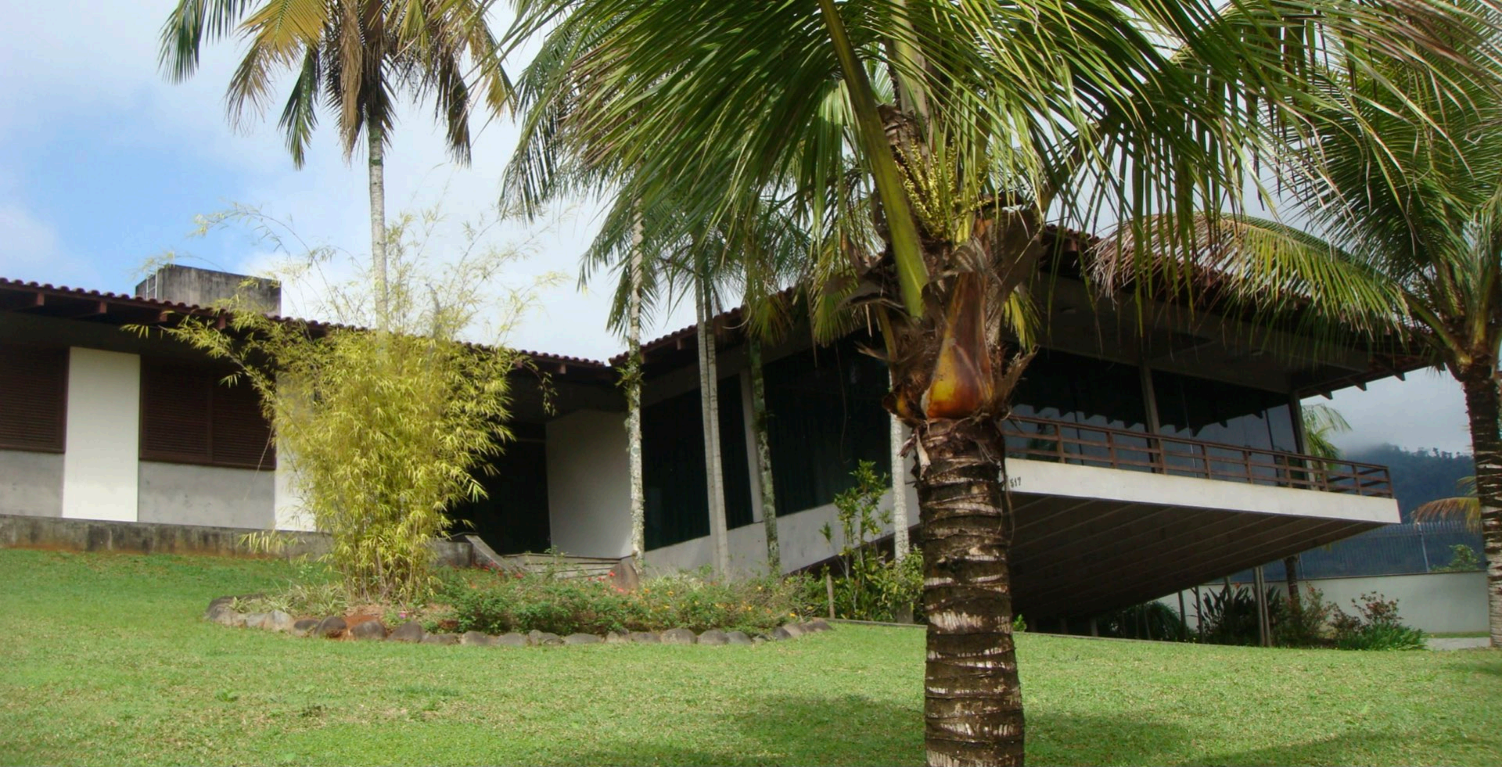
Residência OW . 480 m2 . Timbó, Santa Catarina