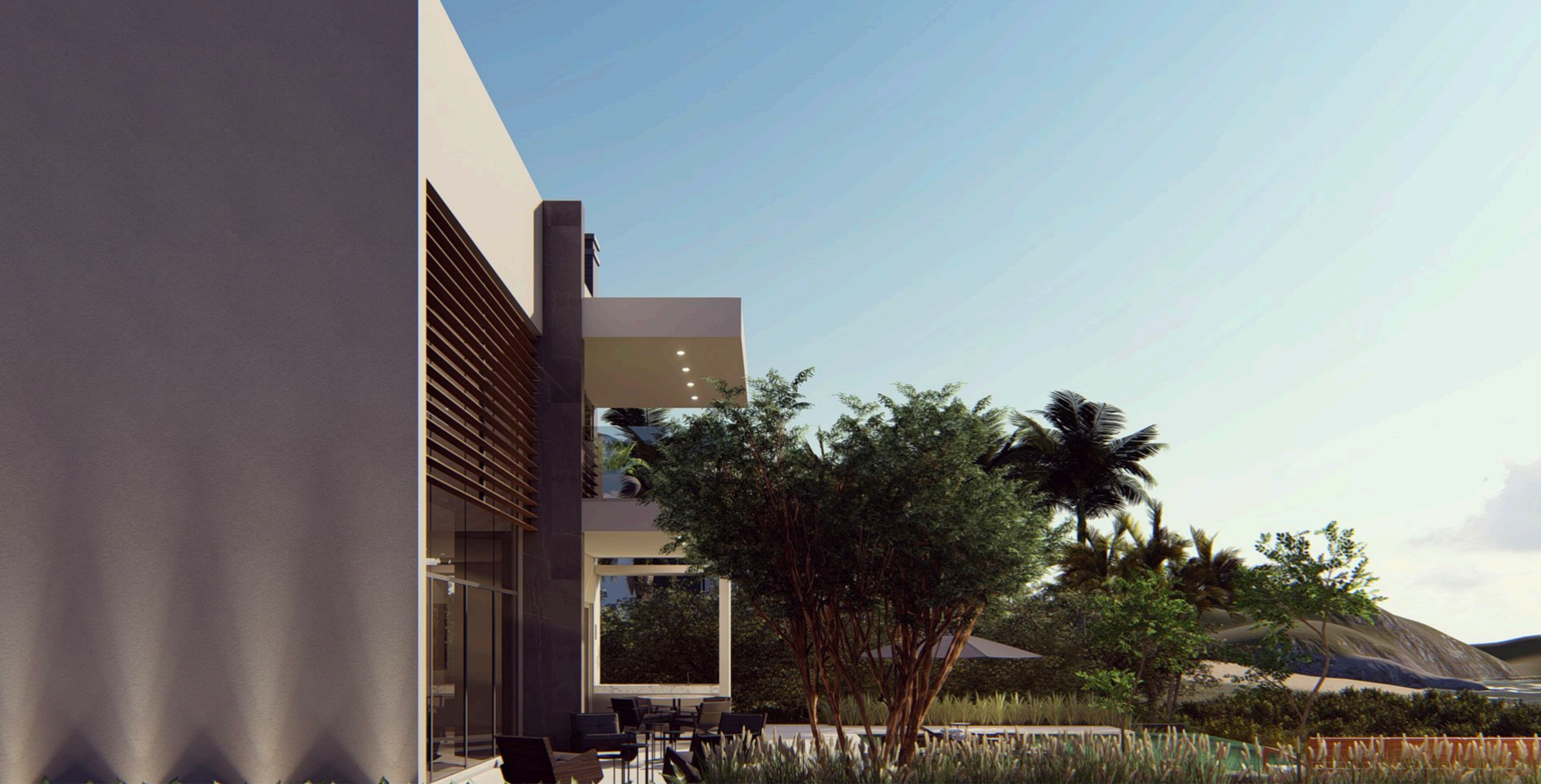
Residência SF . 750 m2 . Balneário Camboriú, Santa Catarina