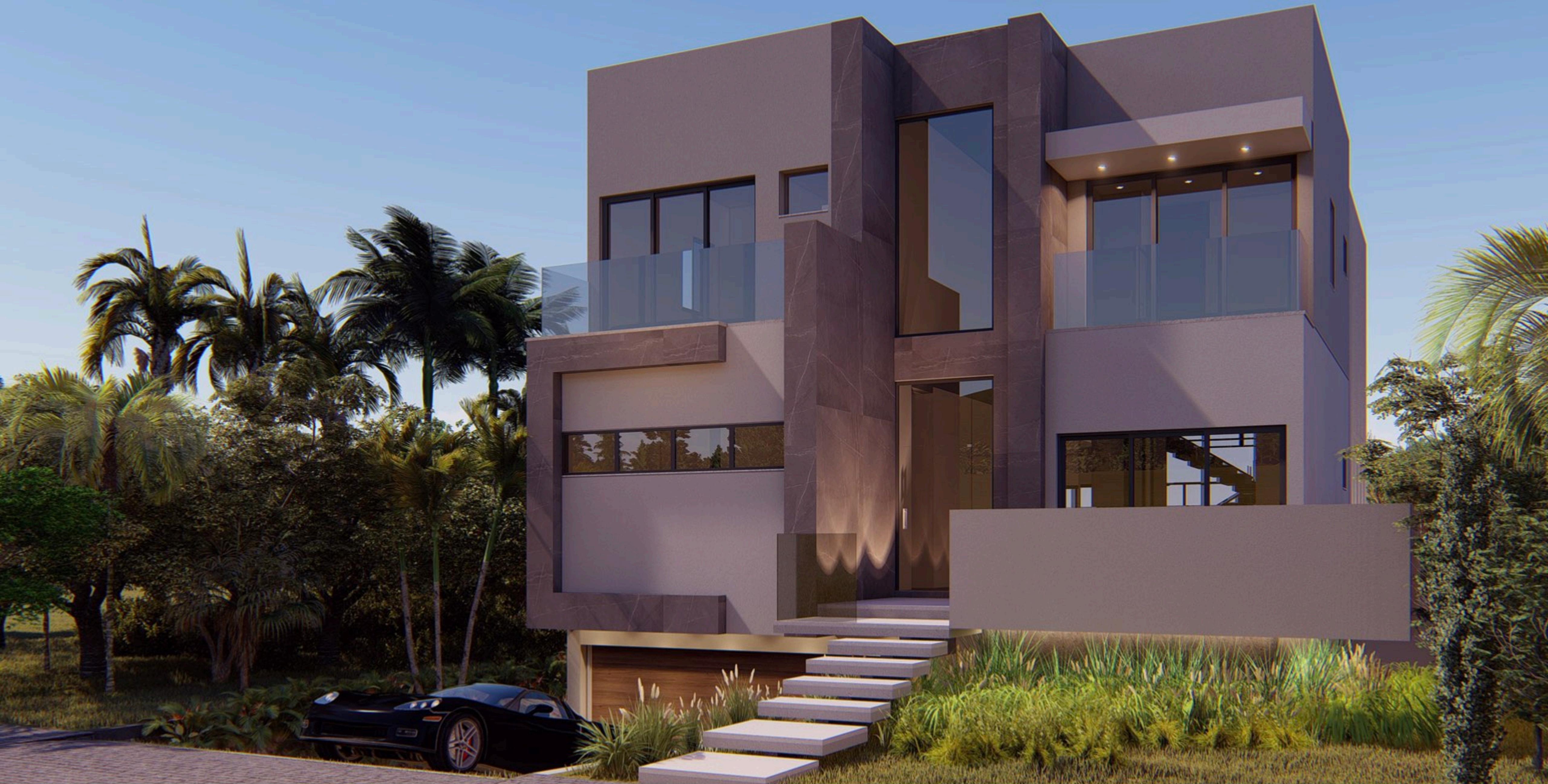
Residência SF . 750 m2 . Balneário Camboriú, Santa Catarina