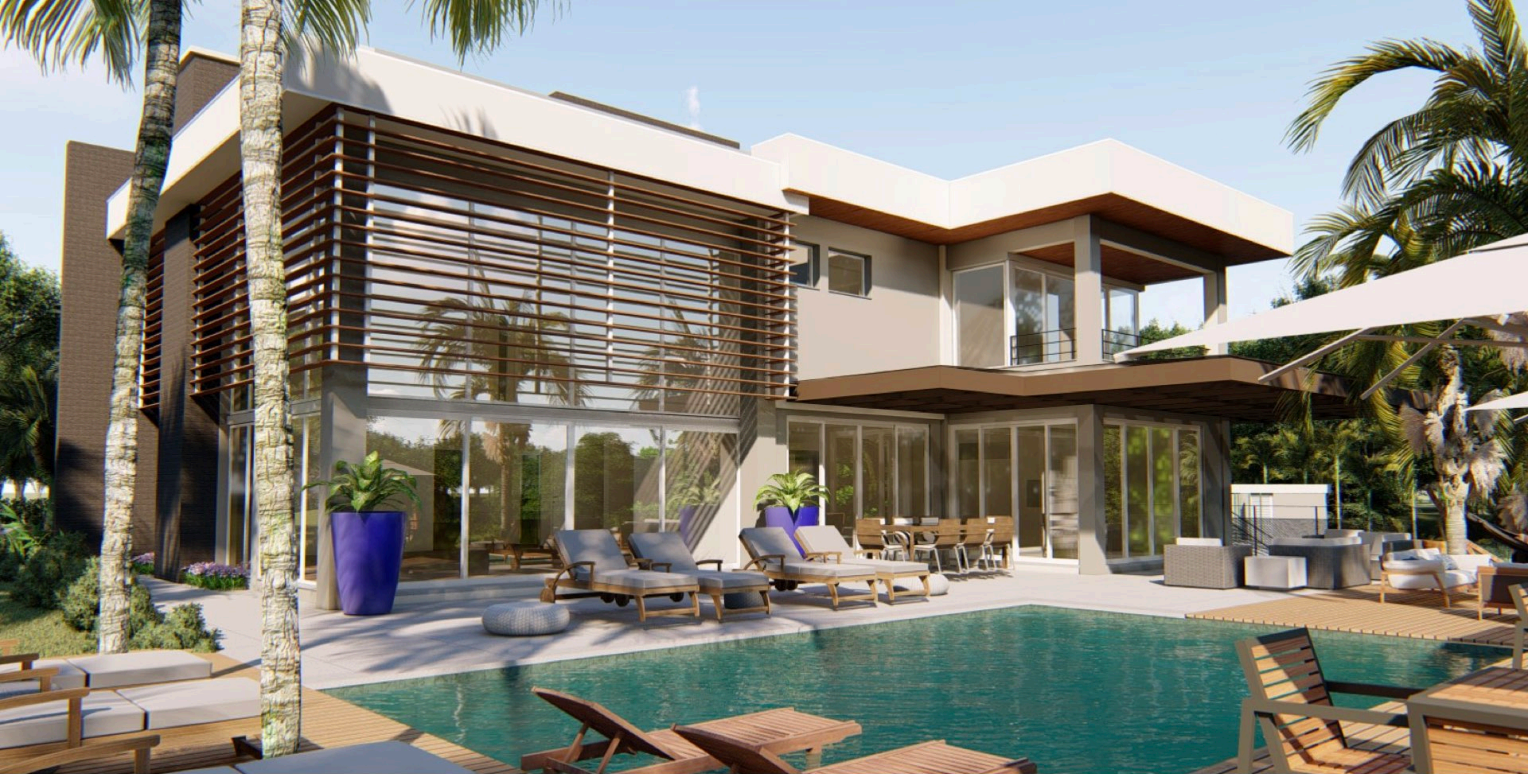
Residência GT . 800 m2 . Blumenau, Santa Catarina