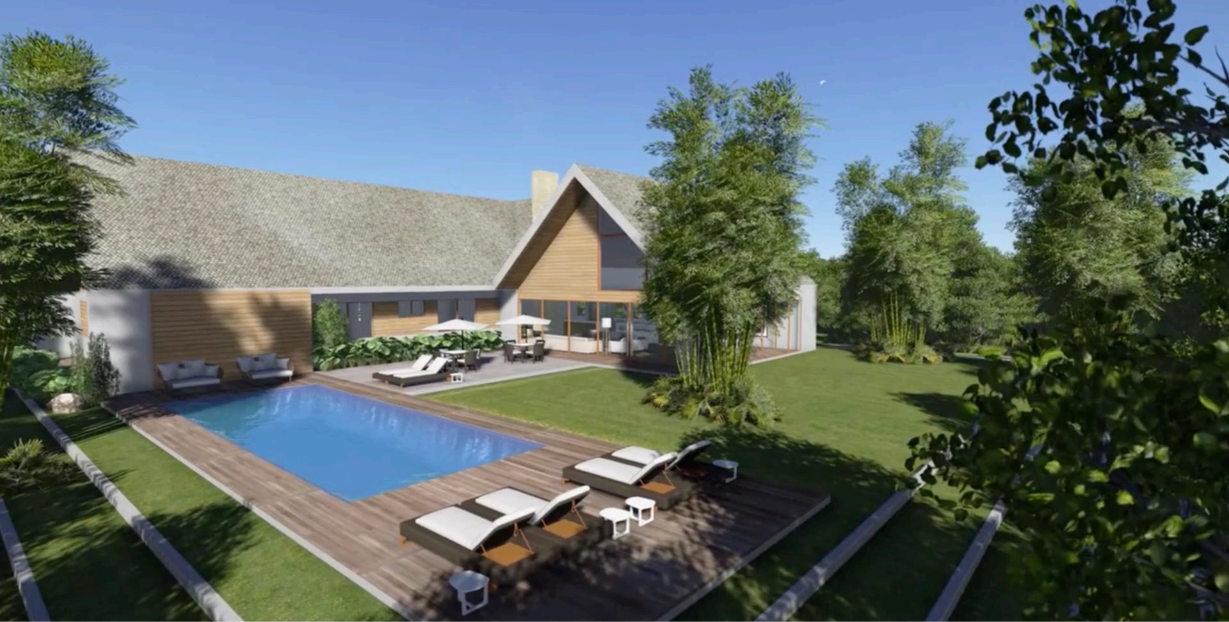
Residência HH . 700 m2 . Morretes, Paraná