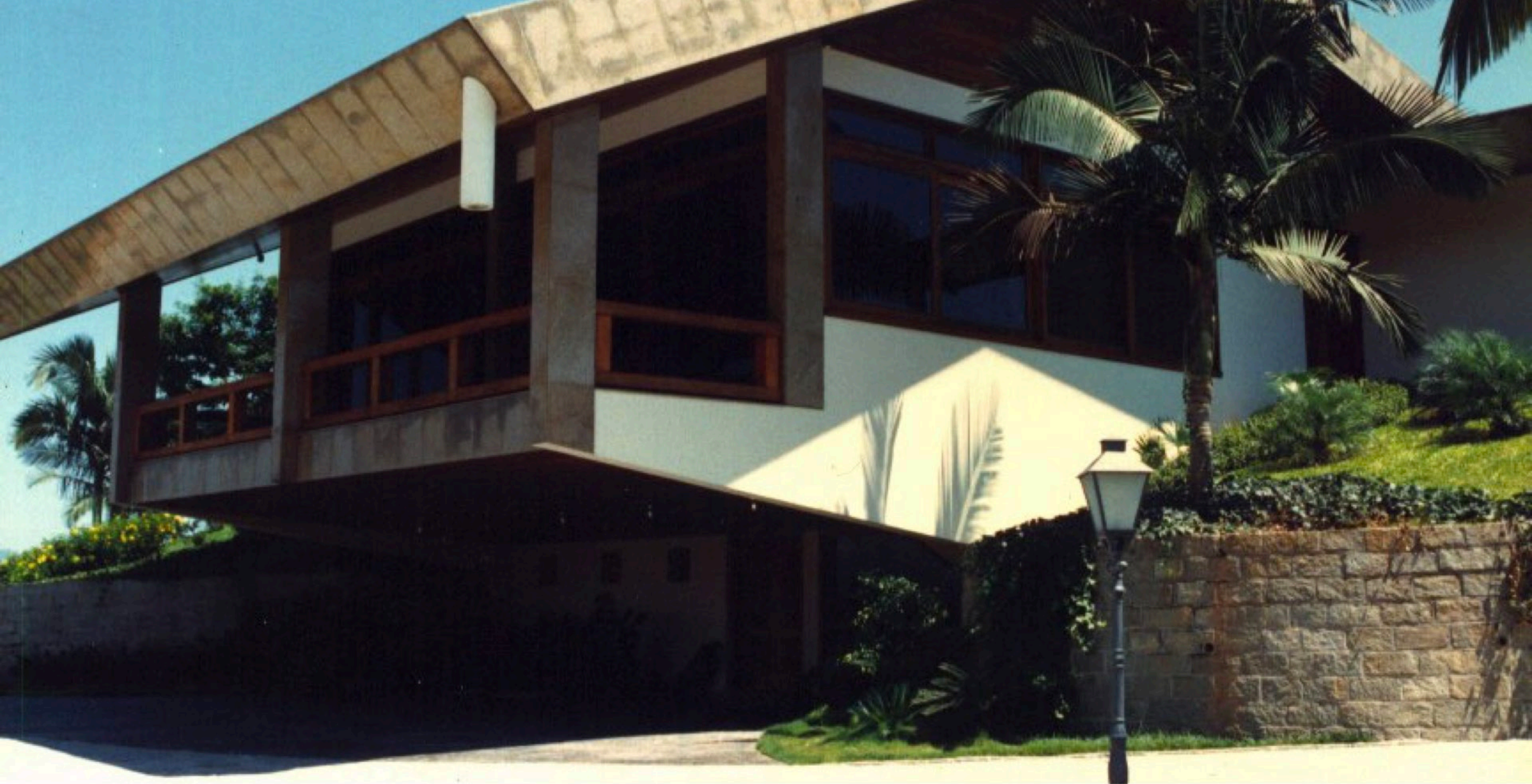
Residência IF . 1.600 m2 . Brusque, Santa Catarina